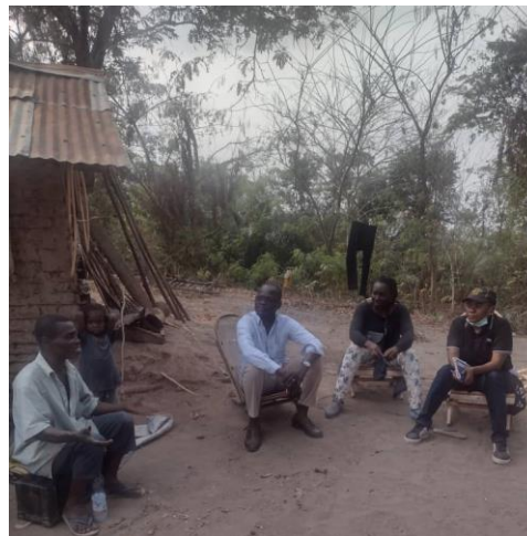
Photo de consultation publique avec le chef de terre à Sonabata