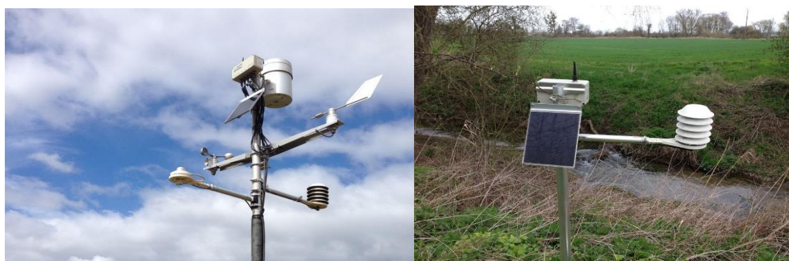
Figure 1 : Image des équipements hydrologiques

Outre les travaux d'installation des équipements hydrométéorologiques, d'autres travaux seront réalisés dans le cadre de sécurisé les équipements par des clôtures en grilles métalliques.