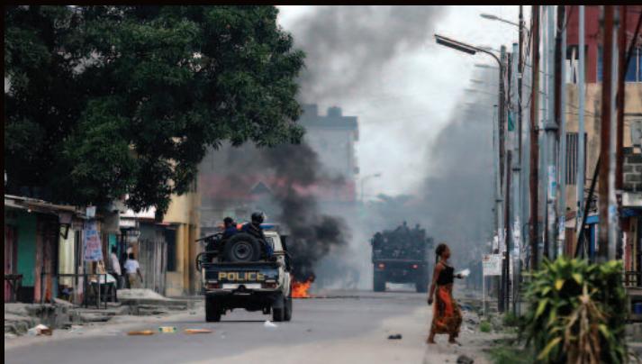
Des policiers congolais passent à côté d'une barricade en feu lors de manifestations à Kinshasa, la capitale de la République démocratique du Congo, le 20 décembre 2016.

Human Rights Watch appelle le président Kabila et les autres hauts responsables à mettre un terme à tout emploi illicite et excessif de la force et aux autres formes de répression contre les manifestants, les activistes et l'opposition politique, et de cesser tout recrutement de combattants du M23 aux fins de participer à une telle répression. Les partenaires internationaux de la RD Congo devraient augmenter la pression sur Kabila pour qu'il quitte ses fonctions conformément à la Constitution et soutenir une transition pacifique et des élections crédibles.