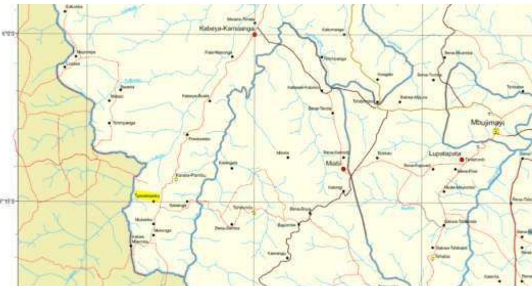
Carte n° 4 : géolocalisation Tshintshianku