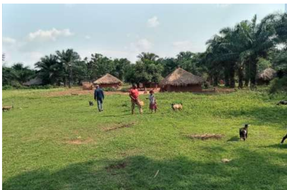
Photo n° 4 : Quelques chèvres en divagation au niveau du village Tshintshanku