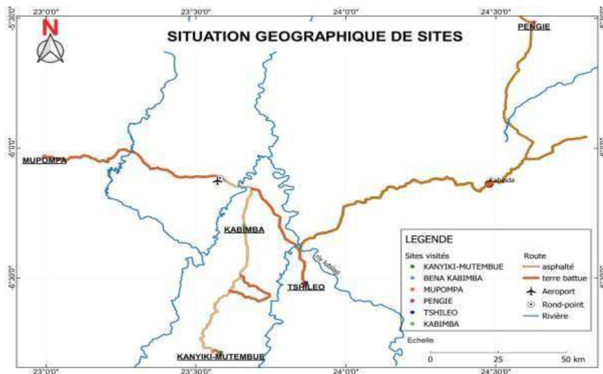
Carte n° 1 : situation géographique des sites des centres de santé dans le Kasai oriental

La phase II du projet PRISE prend en compte quatre sites pour le Kasai-Oriental dont trois villages qui sont Mpanda Kakangayi, Mupompa et Tshintshianku dans le territoire de kabeya- Kamuanga et bena Kabimba dans le territoire de Tshilenge. La figure ci-dessous illustre la situation géographique des sites dans la province du Kasai Oriental.