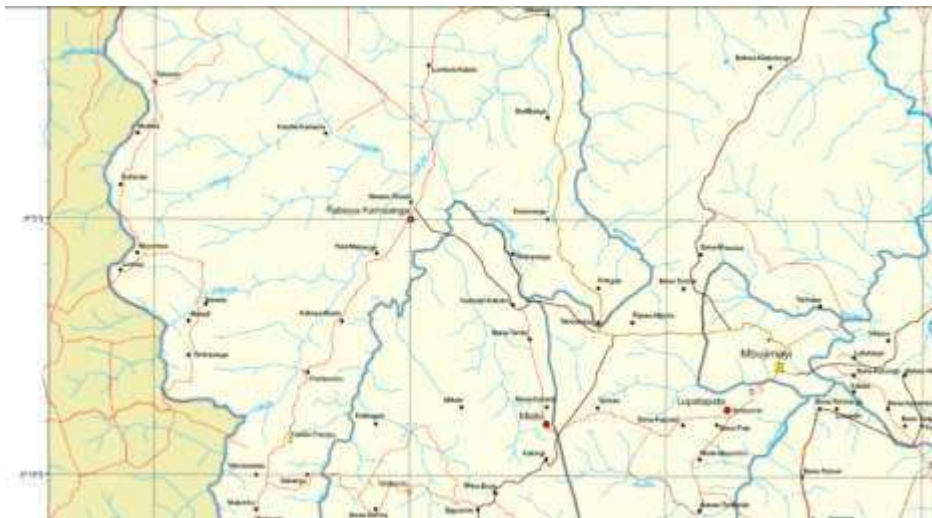
Carte n° 3 : Géolocalisation de Mpanda kakangayi badibanga

Le village Mpanda Badibanga est un groupement de plusieurs localités dans le territoire de Kabeya kamuanga à 95 km de Mbuji-Mayi. Il est dirigé par un Chef de Groupement qui habite ce Village Mpanda badibanga.